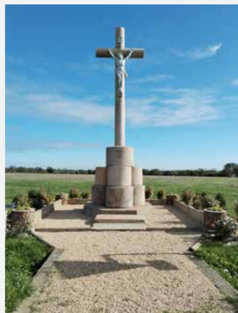
Restauration du calvaire de la Jousselinière