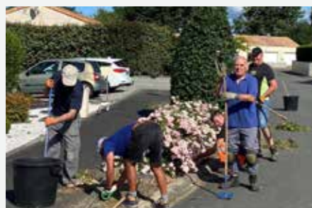
Nettoyage des massifs au domaine du Rivage