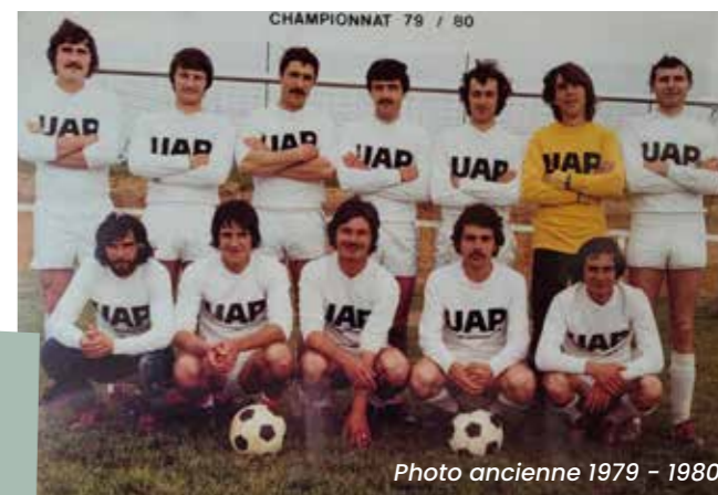
Photo ancienne 1979 - 1980