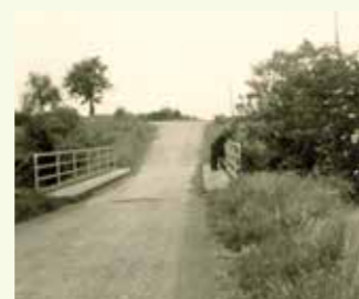
Les travaux de la rue de la Renaudière sont terminés depuis cet été. La rue a bien changé depuis les années 1950.