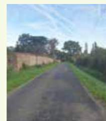
Voirie de la Fortécuyère