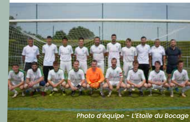
Photo d'équipe - L'Étoile du Bocage