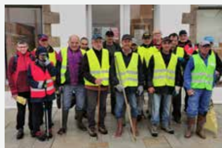
Collecte de déchets dans les fossés