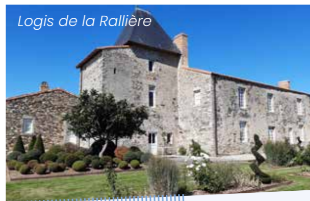
Logis de la Rallièrre