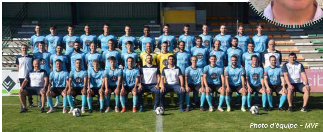
Photo d'équipe - MVF