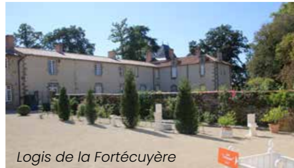
Logis de la Fortécuyère