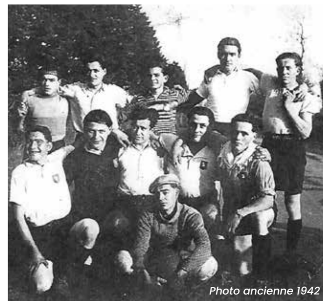
Photo ancienne 1942