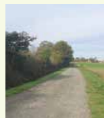
Chemin du Canada