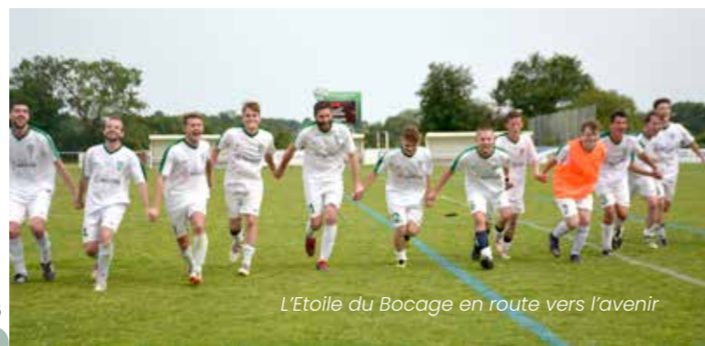
L'Étoile du Bocage en route vers l'avenir

Cela va permettre de garder le football à la Boissière de Montaigu et donner l'occasion aux joueurs les plus compétitifs d'atteindre des divisions plus élevées. L'équipe A étant en R2 et l'équipe D en D4, tous les niveaux seront représentés. Par ailleurs, le Montaigu Vendée Football (MVF) propose du foot en salle, du foot adapté et du foot féminin pour que notre sport soit vraiment accessible à toutes et tous.