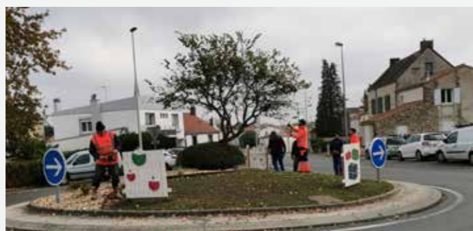
Préparations des décors pour Noël