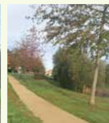
Allées domaine du Rivage