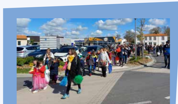
Carnaval des enfants 2022