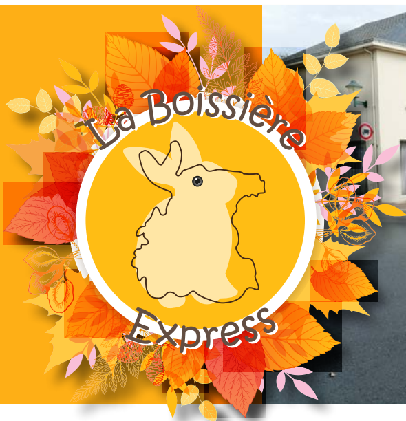
Décor de rues 2019 - Atelier des Passages